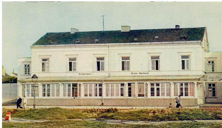
Kinderheim Kreis Waldeck (1954)

Zur Zeit des Krieges war die einst anspruchsvolle Anlage heruntergekommen. Es wohnten Soldaten und Flüchtlinge dort. 1953 ging die Hotelanlage Konkurs, und sie wurde in Stücken verkauft. Der damalige Landrat des Landkreises Waldeck, Dr. Hanke, war 1953 im Urlaub auf Norderney. Hier erfuhr er durch Zufall, dass die Hotelanlage an der Kaiserstraße veräußert wurde. Er erwarb für 55 000 Mark ein Haus der Hotelanlage und das zerbombte leere Grundstück daneben.