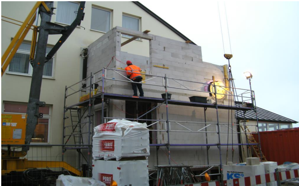
↙ Dezember 2013

Bis 2015 wird es für insgesamt rund 600.000 Euro nach brandschutztechnischen Vorgaben umgebaut und saniert.