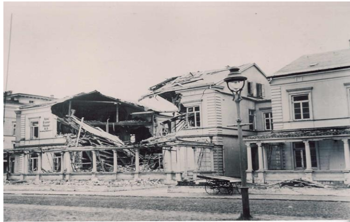
Zerstörtes Haus der Hotelanlage (1944)