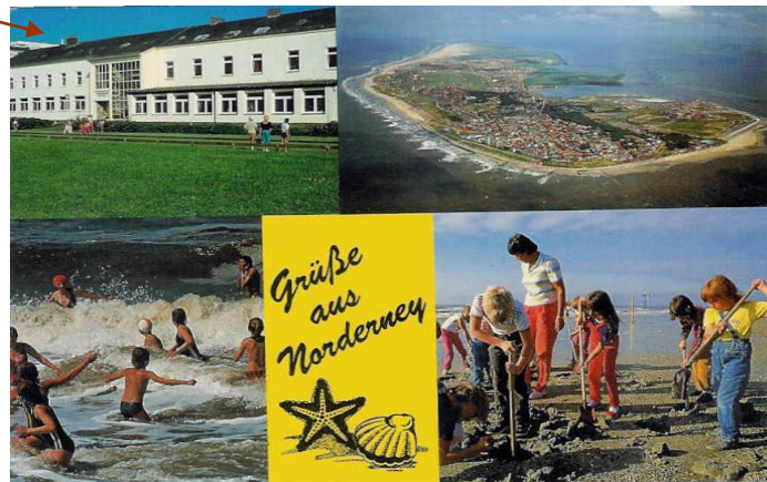
Postkarte Norderney (1965)

Wegen hoher Nachfrage wurde 1963 das fehlende Gebäude auf dem Nachbargrundstück ersetzt und an das bestehende angebaut. Mit 30 Mitarbeitern hatte es 3mal so viele Mitarbeiter wie heute.